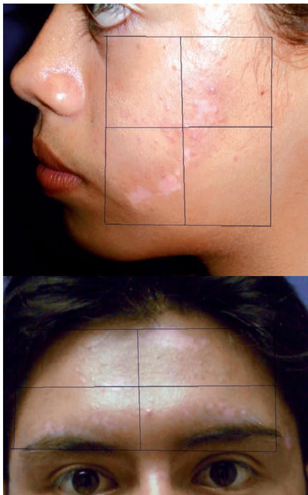
Figura 2. UVB de banda estrecha más placebo: despigmentación al inicio del 20% y despigmentación al término del estudio del 10%. Repigmentación conseguida del 50%.

pacientes repigmentación grado 2. En el grupo B, un paciente tuvo repigmentación grado 4, dos pacientes grado 3 y uno, grado 2 (Figura 2). El número de sesiones que los pacientes recibieron fue entre 25 y 48 sesiones. El grupo A tuvo un promedio de 42 \pm 5 sesiones y una media de 43 \pm 8 J/cm 2 y el grupo B la media de sesiones fue 39 \pm 9 , y una media de 49 \pm 16 J/cm 2 (Figura 3).